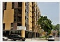
Résidence Le Mile-End Le Plateau Mont-Royal