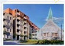
Résidence Saint-Eugène Rosemont- La Petite Patrie