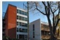
Résidence Jean-Placide-Desrosiers Lachine