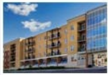
Résidence Rosalie-Cadron Ahuntsic-Cartierville