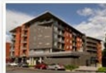
Résidence Côte-Saint-Paul Le Sud-Ouest