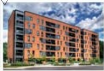
Résidence Maywood Pointe-Claire